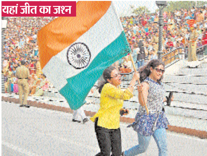
वर्ल्ड कप सेमीफाइनल में टीम इंडिया के पाकिस्तान को हारने के बाद गुरुवार को अमृतसर में वाघा बॉर्डर पर स्ट्रीट के दौरान कुछ ऐसा मना था।